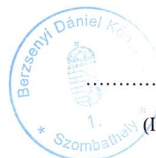
Nagy Éva (Intézményvezető)